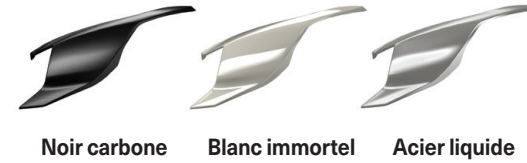
Noir carbone Blanc immortel Acier liquide