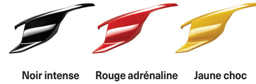
Noir intense Rouge adrénaline Jaune choc