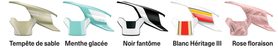
Tempête de sable Menthe glacée Noir fantôme Blanc Héritage III Rose floraison