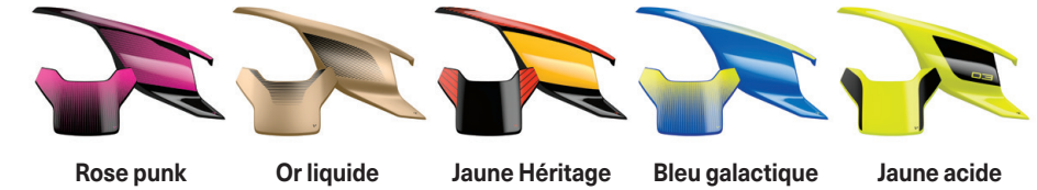
Rose punk Or liquide Jaune Héritage Bleu galactique Jaune acide