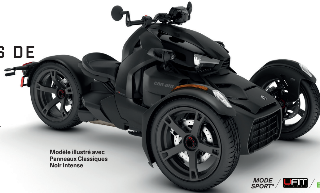
Modèle illustré avec Panneaux Classiques Noir Intense