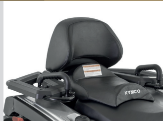
KIT CONFORT PASSAGER KA-01-0639