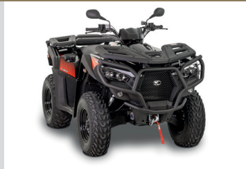
BUMPER AVANT NOIR Pour MXU 550 / 700 A PARTIR DE 2019 KA-01-0554