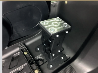
REPOSE-PIEDS PASSAGER REGLABLES KA-01-0653